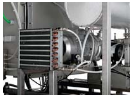
Condensate drain cooler and vacuum pump / Raffreddamento della condensa sullo scarico e della pompa del vuoto