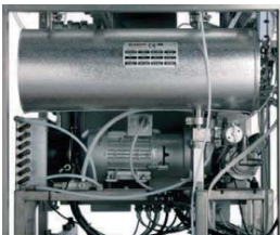
Separated steam generator with water booster pump / Generatore di vapore esterno con pompa d'acqua