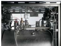
Modulating valve on steam inlet Valvola modulante nell'ingresso vapore