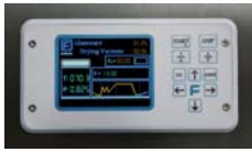
FVG & FVS - TSC 09 Microprocessor FVG & FVS - Microprocessore TSC 09