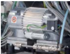
FVG - Vacuum pump FVG - Pompa del vuoto