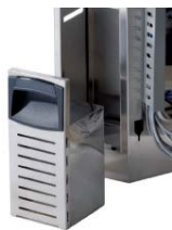
FVS - Front mounted condensate tank FVS - Tanica frontale per recupero condensa