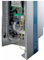
FVS - Stainless steel removable paneling FVS - Pannellatura removibile in acciaio inossidabile