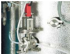
FVG - Membrane safety device for preventing lid opening even in case of minimal over pressure FVG - Dispositivo di sicurezza a membrana per evitare l'apertura del coperchio anche in case di minima sovrappressione