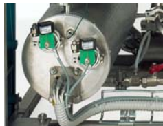
FVG & FVS - Steam generator FVG & FVS - Generatore di vapore