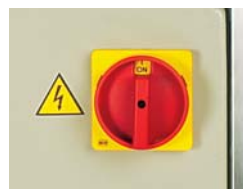
FVG - Main switch for emergency stop FVG - Interruttore principale per emergenza